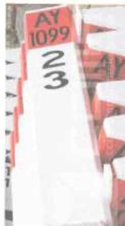
Imagen referencial N°02

Se pintará las progresivas de fondo color blanco, letras color negro, y escritura de la siguiente manera por ejemplo 02+300.