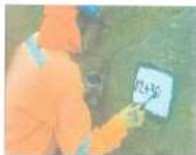
Imagen referencial N°01

Se pintará las progresivas de fondo color blanco, letras color negro, y escritura de la siguiente manera por ejemplo 02+300.