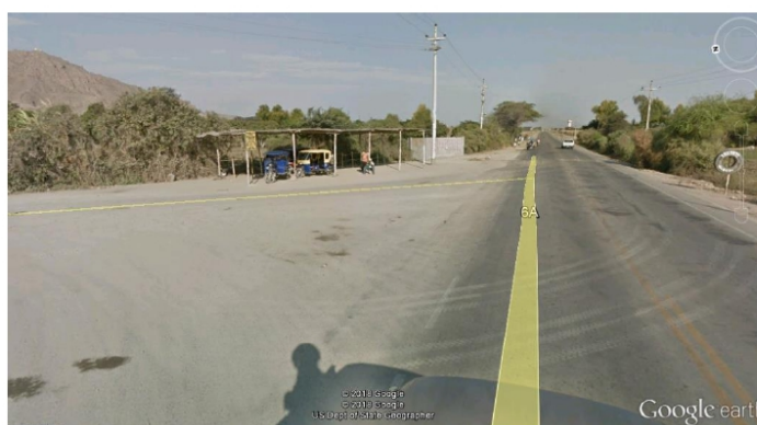
Figura N° 02: Vista de cruce CP. Conchucos.