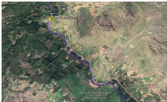
Figura N° 01: Localización de Actividad