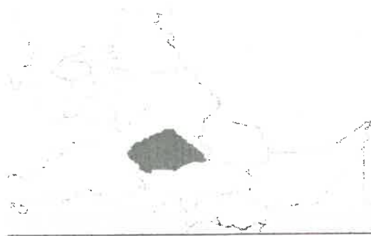
Provincia de Atalaya

La Provincia de Atalaya es una de las cuatro provincias que conforman el Departamento de Ucayali, bajo la administración del Gobierno regional de Ucayali, en el Perú. Limita al norte con el departamento de Loreto, al oeste con los de Huánuco y Pasco, al sur con los de Junín, Cuzco y Madre de Dios, y al este con el territorio brasileño del estado de Acre.