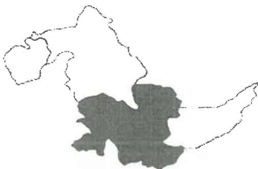
Distrito de Tahuaná