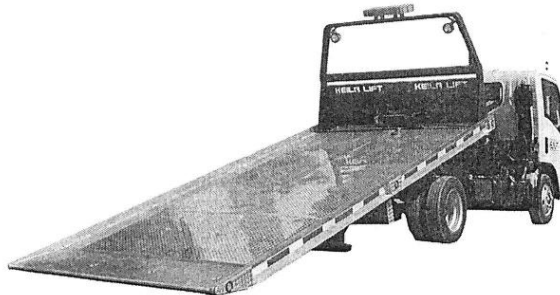
IMAGEN REFERENCIAL DE GRUA N° 01