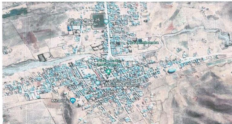
Elaboración de Equipo Técnico -2023

SUB GERENCIA DE INFRAESTRUCTURA DESARROLLO URBANO RURAL