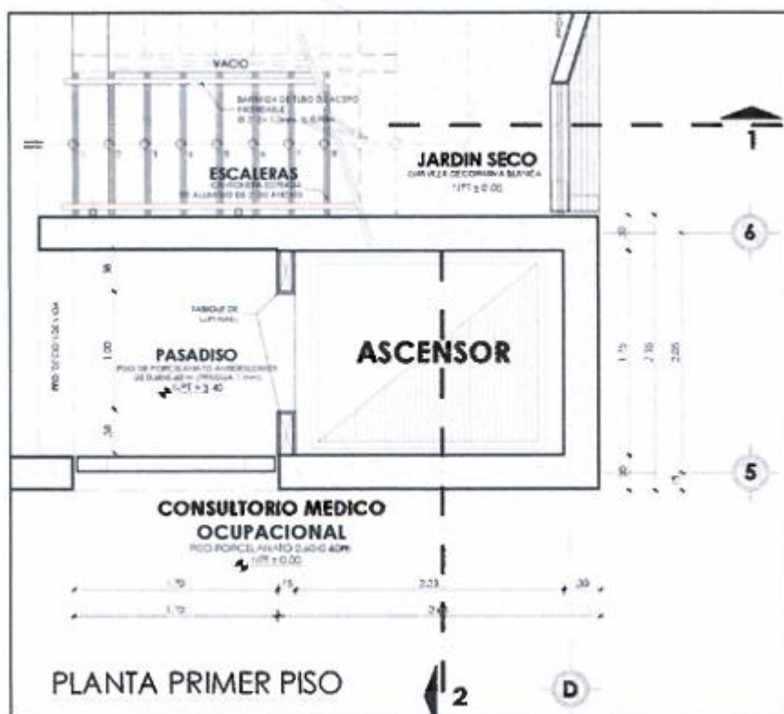
Imagen 04. Vista en planta de ascensor primer piso