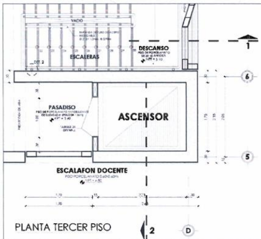
Imagen 06. Vista en planta de ascensor tercer piso