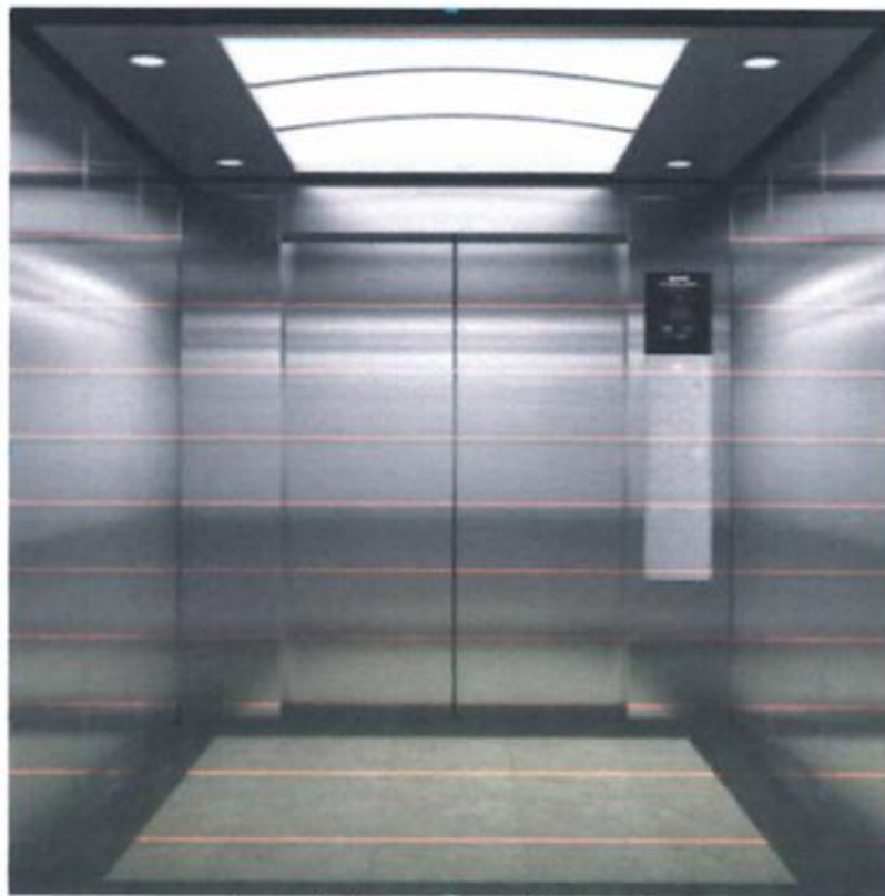
Imagen 01. Imagen referencial de la cabina