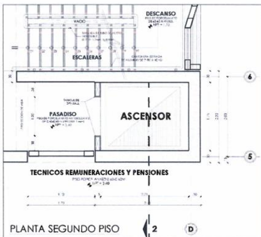
Imagen 05. Vista en planta de ascensor segundo piso