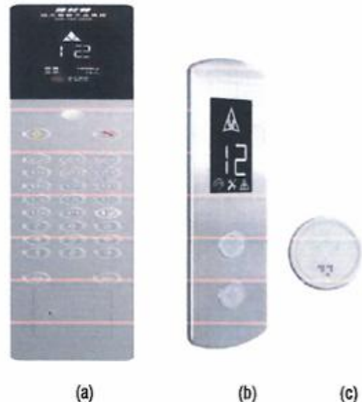
Imagen 02. Imagen referencial de botoneras (a).cabina (b) exterior (c) botón

Motor eléctrico del tipo tracción síncrono de rotor interno con excitación por imanes permanentes, debe reunir todas las características que se exigen actualmente a un moderno accionamiento para elevadores: un montaje sencillo, una capacidad de regulación óptima, un bajo nivel de ruido, un elevado confort de viaje y un diseño compacto. Con adecuado aislamiento, suave y silencioso con freno electromecánico de discos, ajustable mediante tornillo y resortes regulables, accionamiento de la bobina mediante corriente rectificada desde el mando en el tablero.