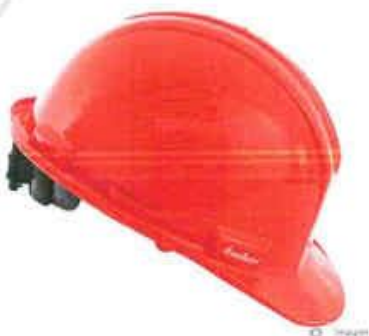
CASO DE SEGURIDAD