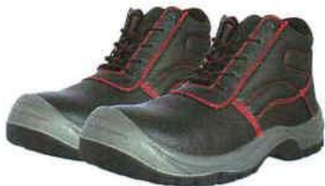
ZAPATOS DE SEGURIDAD TRABAJO – SEGURIDAD