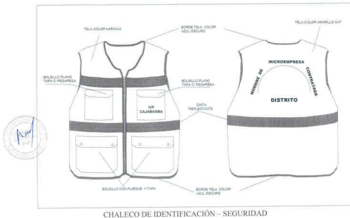
CHALECO DE IDENTIFICACIÓN – SEGURIDAD

INSTITUTO DE VIALIDAD MUNICIPAL DE LA PROVINCIA DE CAJABAMBA AÑO 2024