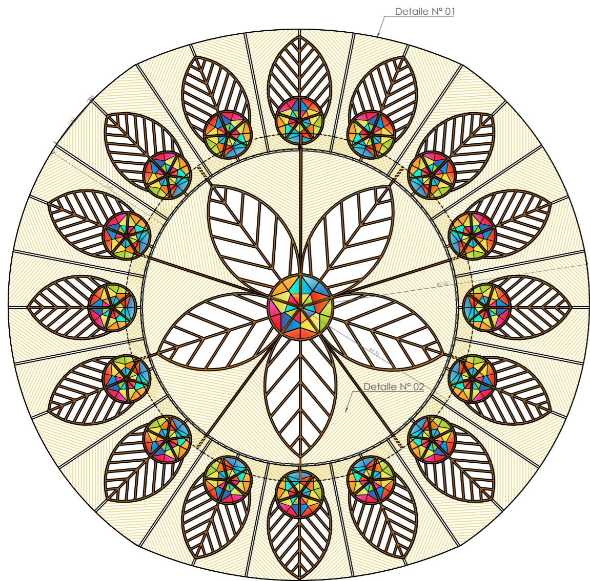
PLANO PRINCIPAL -TECHOS VISTA SUPERIOR