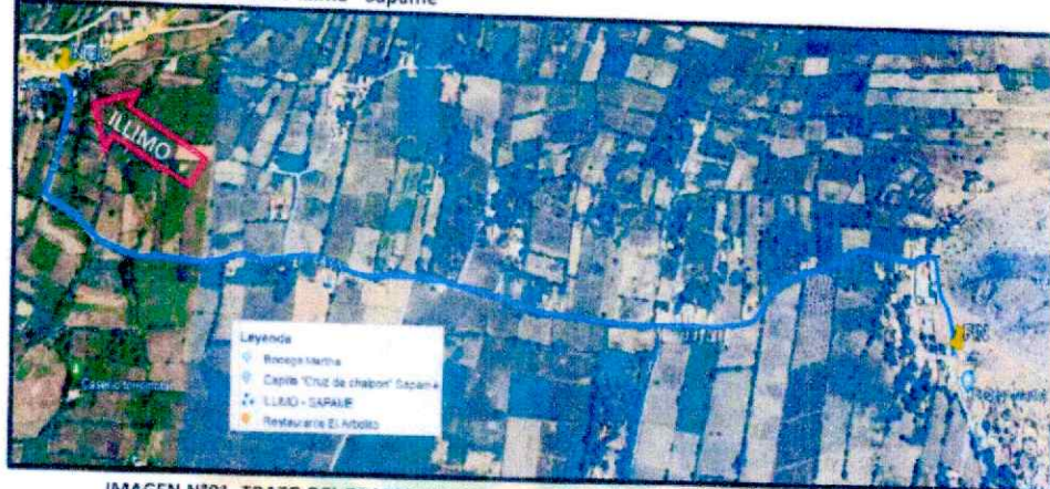
IMAGEN N°01. TRAZO DEL TRAMO ILLIMO - CASERIO SAPAME

Ubicación específica del Tramo Illimo - Sapame