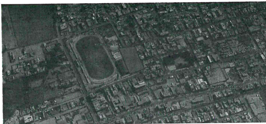
IMAGEN SATELITAL DEL ÁREA DE INTERVENCIÓN