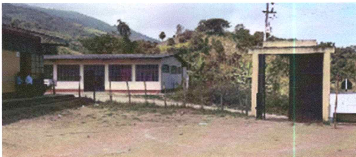
Figura 02: Cerco perimétrico en el frente de I.E N°14407