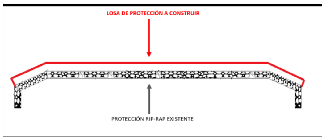
Fig. 4: Estructura de protección RIP-RAP – Línea de Conducción San Bartolo cruce Río Lurín – CORTE B-B