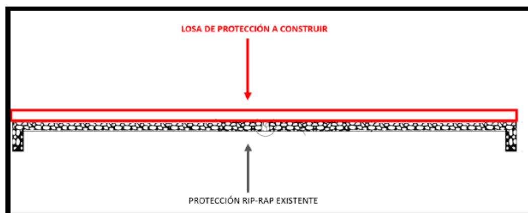
Fig. 5: Estructura de protección RIP-RAP – Línea de Conducción San Bartolo cruce Río Lurín – CORTE A-A