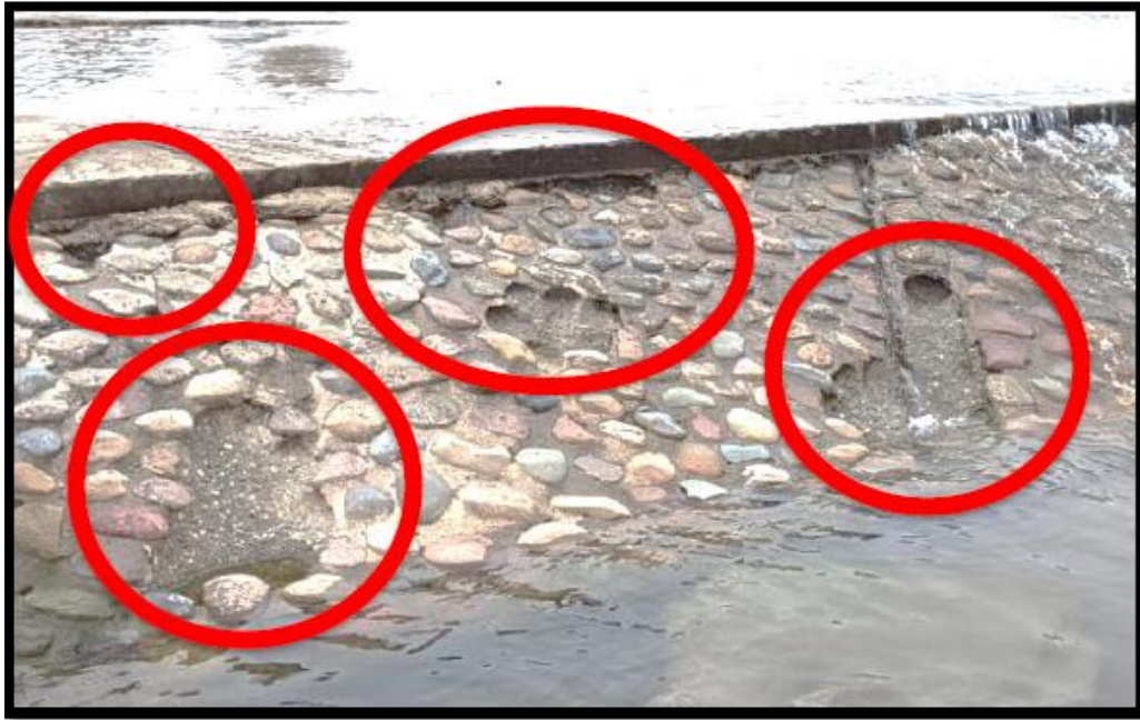
Fig. 2: Parte de las zonas para resane de la estructura RIP-RAP. Imagen referencial.