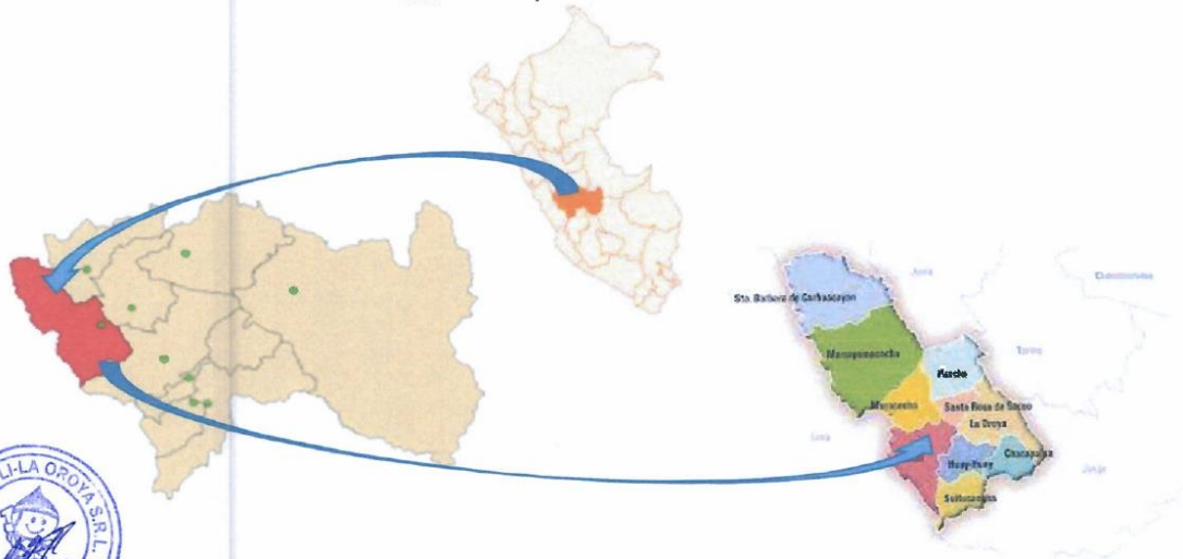
Ubicación de la provincia de Yauli – La Oroya