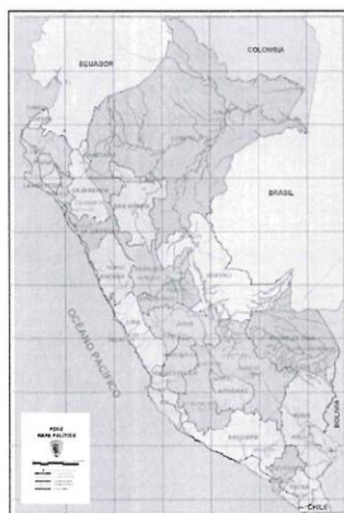
GRAFICO N°01 MAPA DE PERÚ