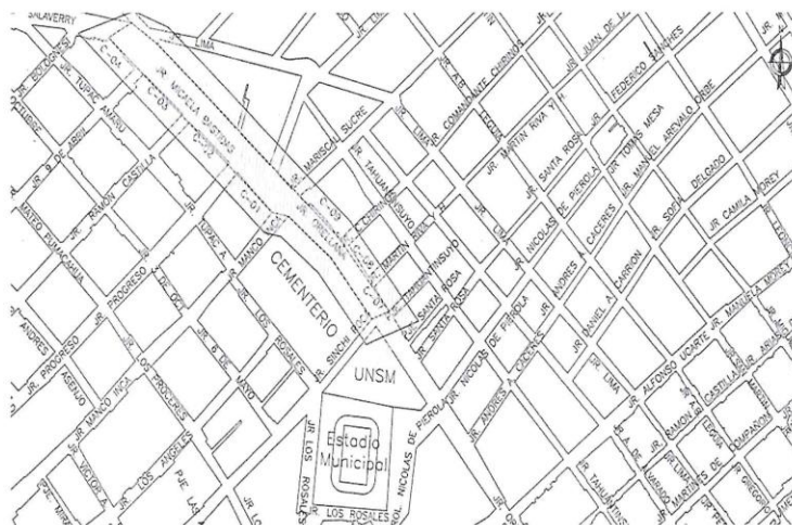
Croquis de ubicación del Proyecto en el Casco Urbano de la Ciudad de Tarapoto