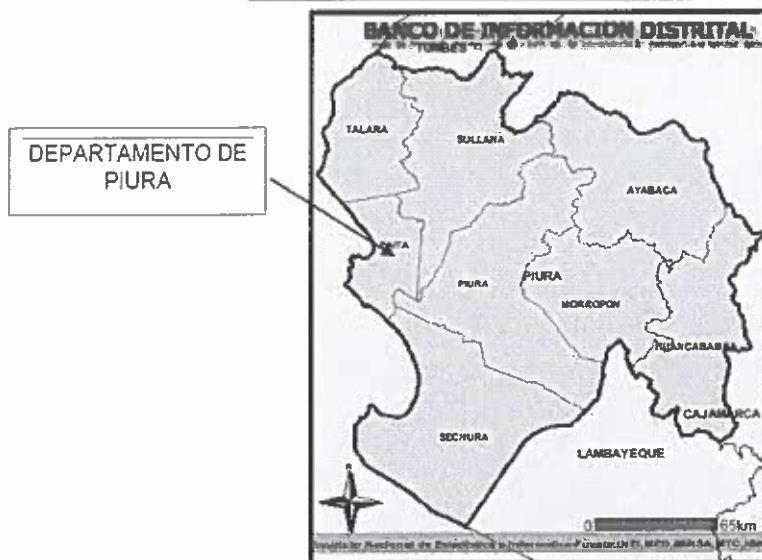
Esquema de Ubicación del Distrito de Colan