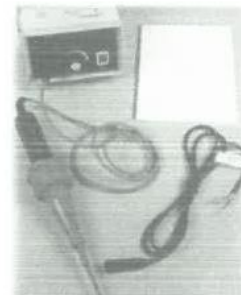
Equipo de Pruebas por Chispa Eléctrica

En el caso particular de que no fuese posible utilizar el procedimiento de caja de vacío debido a que la geometría de la superficie sea muy irregular o curva (esto debe determinarse antes de ejecutar la soldadura por extrusión) se puede evaluar la estanqueidad de la unión por medio de la prueba de chispa eléctrica. La prueba de chispa eléctrica se lleva a cabo colocando a lo largo del borde del traslape superior un delgado alambre conductor. Una vez realizada la soldadura este queda embebido en el cordón de polietileno de aporte. En seguida, un dispositivo semejante a una escobilla metálica es conectado a una fuente de 20 kV, el que es guiado lentamente por un operador sobre y a lo largo de la línea de soldadura. La existencia de un conducto libre entre el alambre embebido y el terminal libre producirá que la unidad emita una señal audible.