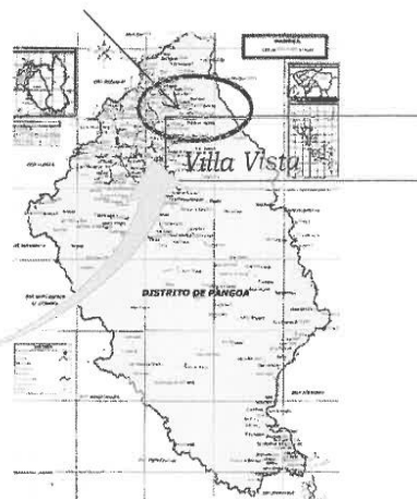
Distrito de Pangoa