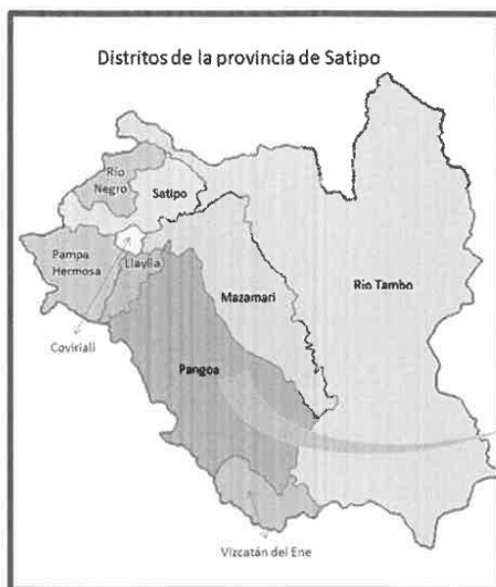
Provincia de Satipo