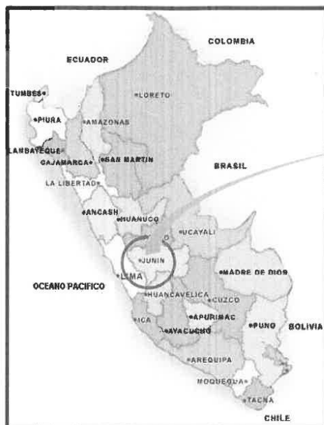
La región Huancavelica en el Perú