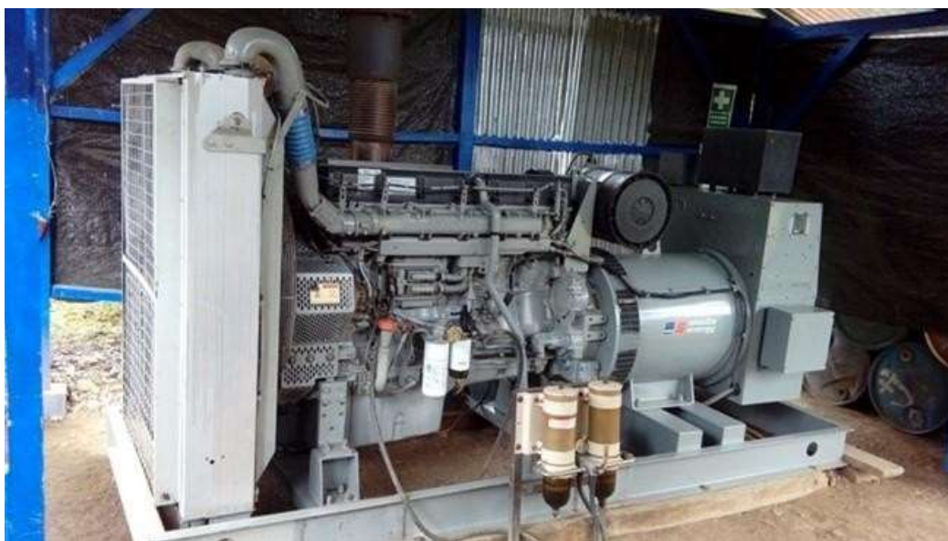
Vista del Grupo Electrógeno VOLVO PENTA de la CT Pozuzo.