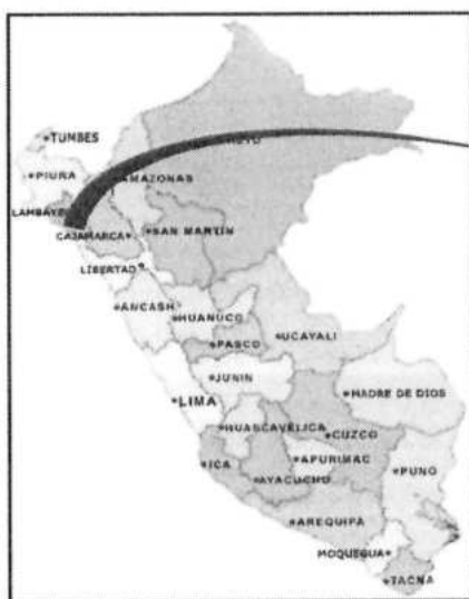
UBICACIÓN DE LA REGIÓN DE LAMBAYEQUE (MAPA N°01)