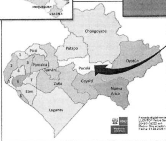
UBICACIÓN DEL DISTRITO DE PUCALA (MAPA N°03)