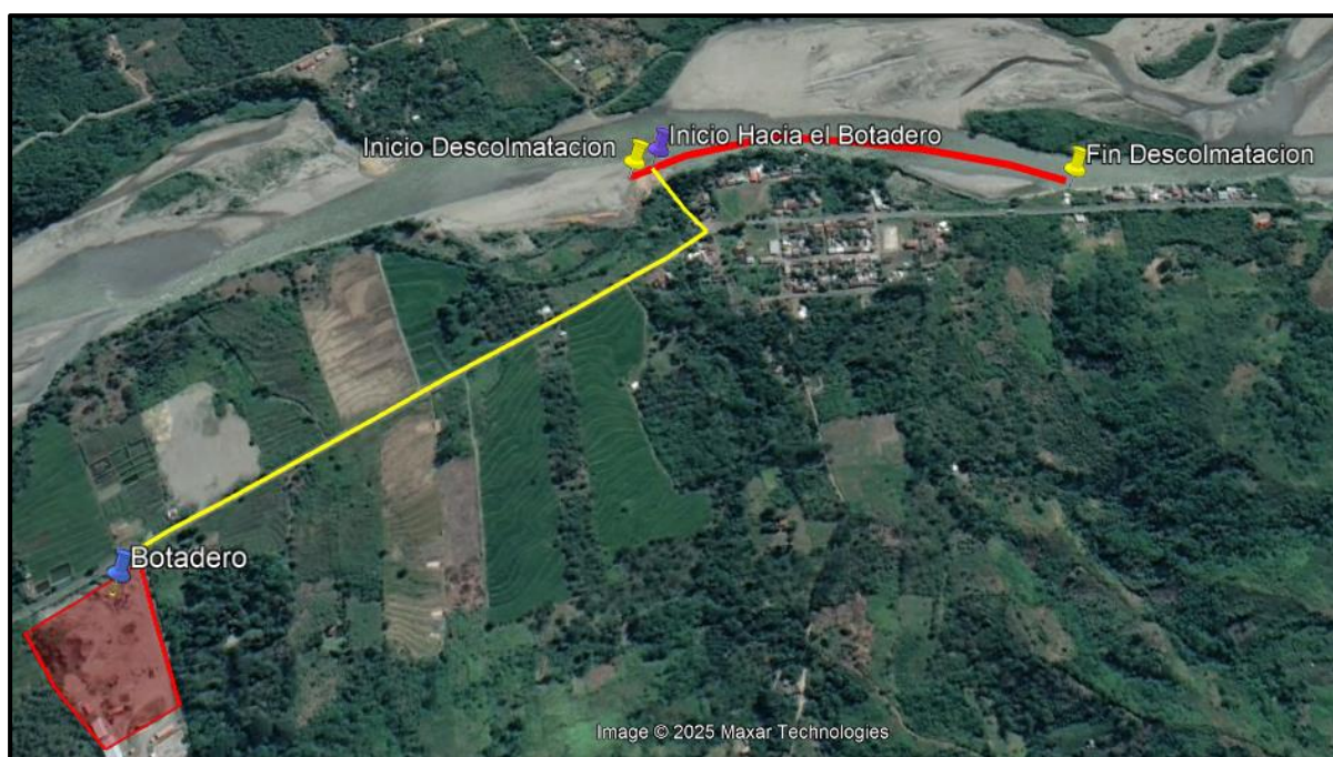
Captura satelital del Área de Intervención

El plazo de ejecución de la Actividad es de Sesenta (90) Días Calendario , en concordancia con lo establecido en el expediente técnico de obra y Cronograma de obra.