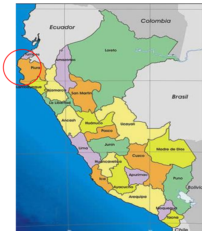
Figura 1. Ubicación departamental