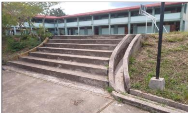
Imagen 2 – Área para la construcción de techado cobertura metálica liviano de la Institución Educativa N°0707 Emilio San Martín.