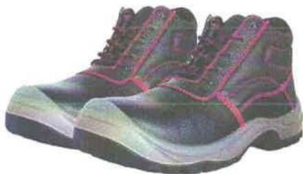
ZAPATOS DE SEGURIDAD TRABAJO – SEGURIDAD

INSTITUTO DE VIALIDAD MUNICIPAL DE LA PROVINCIA DE CAJABAMBA AÑO 2024