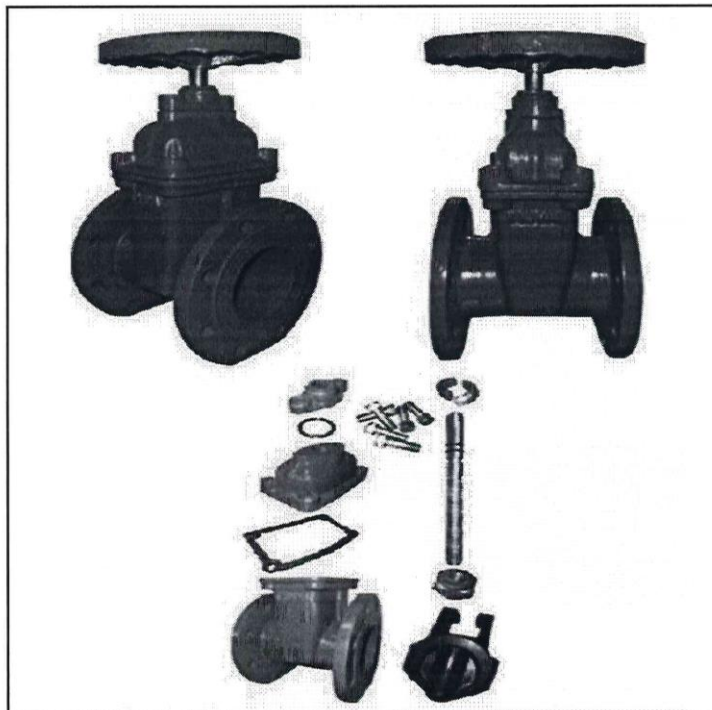
FIGURA 1: IMAGEN REFERENCIAL VALVULA COMPUERTA HD BB