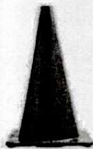
CONO DE SEGURIDAD