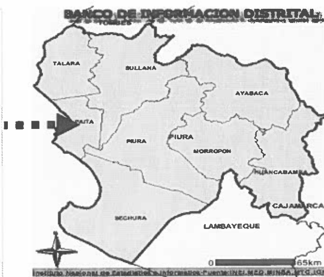
Esquema de Ubicación Geográfica en el Mapa del Departamento de Piura.