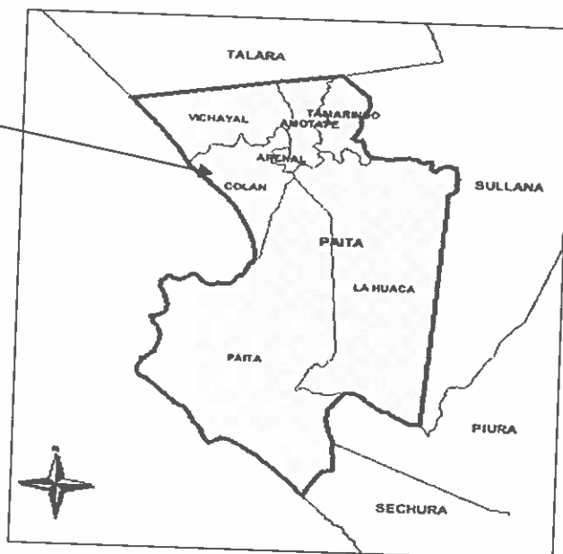
Esquema de Ubicación del proyecto