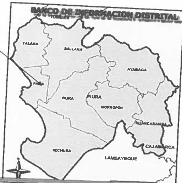
Esquema de Ubicación Geográfica en el Mapa de la Provincia de Paita.