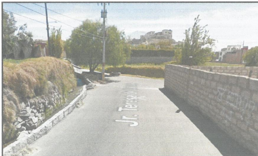
IMAGEN SATELITAL N° 02 VISTA DEL AREA DE INTERVENCIÓN

❖ INICIO: 16°42'28.27"S 71°56'51.13"O FIN: 16°42'45.17"S 71°58'74.40"O