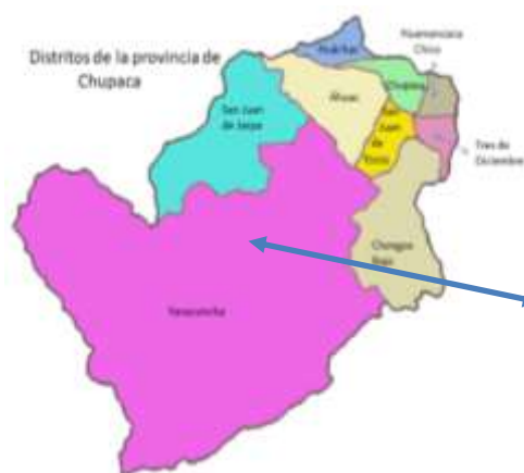
DISTRITO DE YANACANCHA