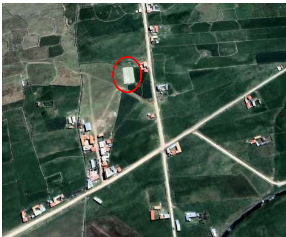
BARRIO UNION LIBERTAD