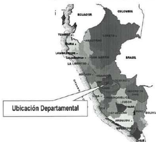
Figura N° 01. Ubicación departamental del proyecto