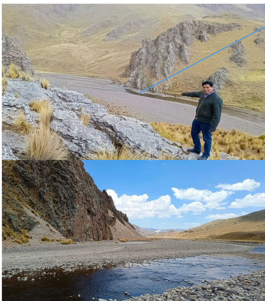
FUENTE DE AGUA

El punto de captación de la fuente de agua es la cuenca y sub cuencas del rio llave, a partir de ahí se deriva sus aguas a través de la infraestructura de conducción precaria.