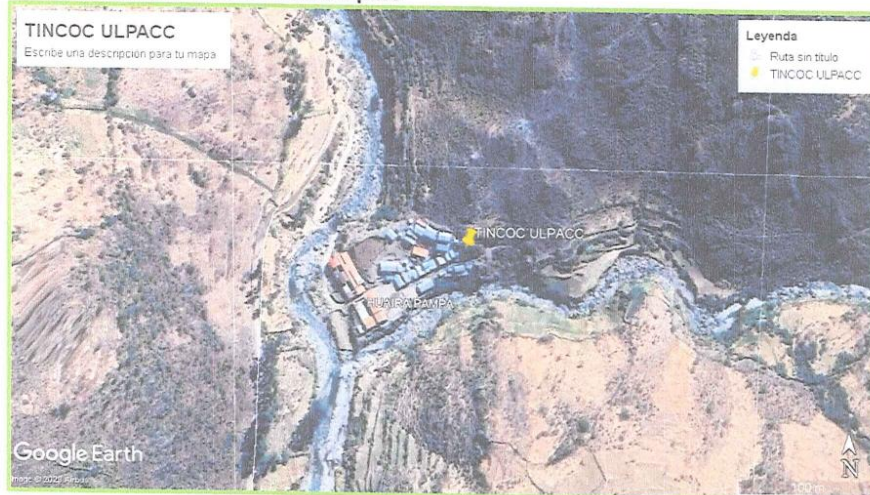
+Mapa N° 05 Vista satelital del Anexo de Tincoc Ulpacc