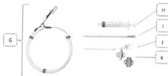
Figura 2 (No incluye diseño)

A: Cuerpo. B: Eje de unión. C: lúmenes. D: Clamp. E: Conector. F: Tapa.