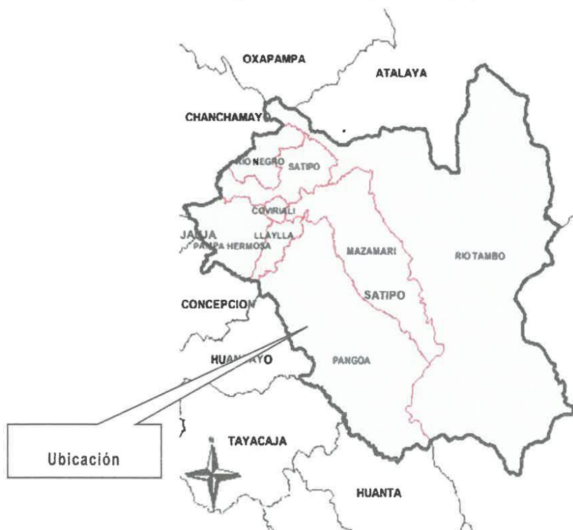
Figura N° 03. Ubicación provincial del proyecto