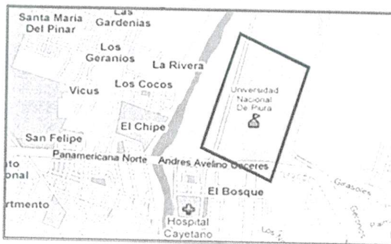
Imagen N° 02

El objetivo de la presente contratación es seleccionar a una persona natural o jurídica que cuente con Registro Nacional de Proveedores con inscripción vigente como Consultor de Obras en la especialidad de Obras Urbanas, Edificaciones y Afines. El consultor será responsable de la elaboración de los estudios definitivos del Expediente Técnico del Proyecto: "MEJORAMIENTO DEL SERVICIO DE GESTIÓN INSTITUCIONAL EN EDUCACIÓN SUPERIOR UNIVERSITARIA EN EL INSTITUTO DE DEPORTES DE LA UNIVERSIDAD NACIONAL DE PIURA, DISTRITO DE CASTILLA, PROVINCIA DE PIURA, DEPARTAMENTO DE PIURA" CUI N° 2629719.