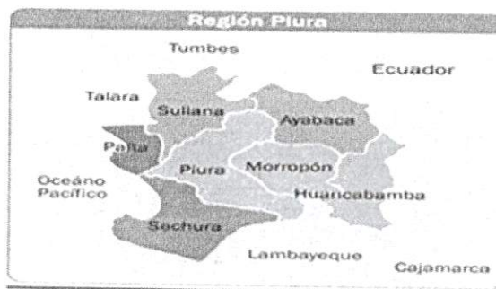
Imagen N° 01

Piura es una provincia del noroeste del Perú situada en la parte central del Departamento de Piura, Limita con la Provincia de Paita y de Sullana al Noroeste, con las de Ayabaca, Morropón y Lambayeque por el este, y con la Sechura por el suroeste. Su capital es la ciudad de Piura.