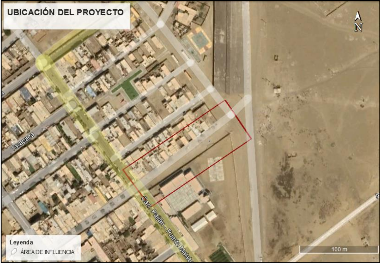
Figura N°4: Ubicación geográfica del proyecto.

Centro Poblado: Puerto de Malabrigo Distrito: Rázuri Provincia: Ascope Departamento: La Libertad