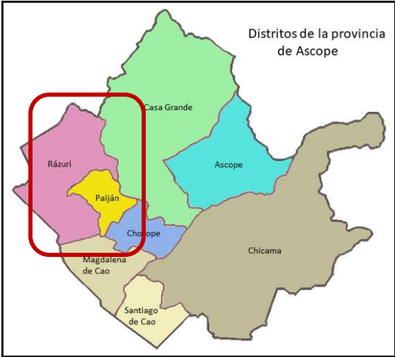
Figura N°3: Ubicación geográfica del distrito de Rázuri.

Centro Poblado: Puerto de Malabrigo Distrito: Rázuri Provincia: Ascope Departamento: La Libertad