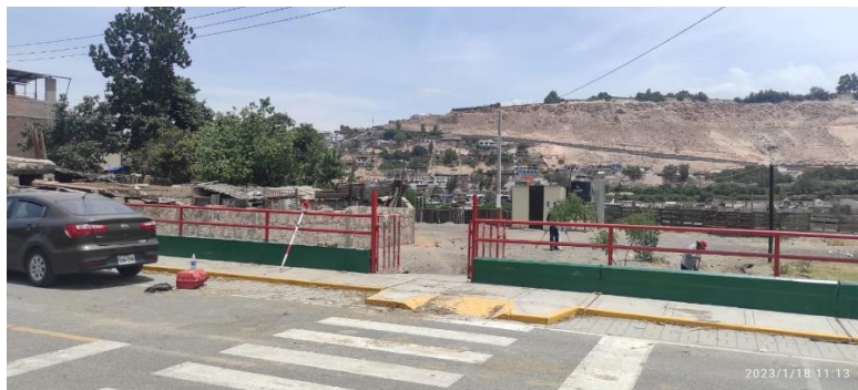
VISTA DEL INGRESO A LA IEI Y LAVATORIOS EXISTENTES