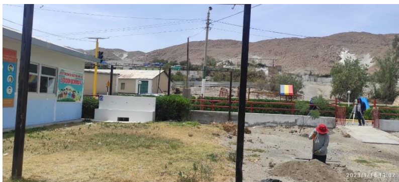
VISTA EXTERIOR DEL AULA PREFABRICADA EXISTENTE