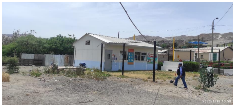
INTERIOR DEL AULA PREFABRICADA EXISTENTE