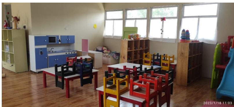
VISTA DEL CERCO PROVISIONAL DE PARIHUELAS DE MADERA