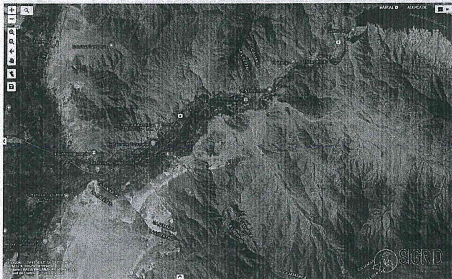
Figura N°01: Fuente de agua – Río Jequetepeque