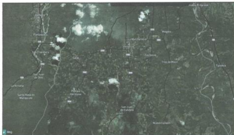
Fopografía N°01: Sub tramo I- Emp.SM-994 (L.D. San Martín) -Paraíso - Gavilán - Tres de Mayo - Dv. Nuevo Canaan.