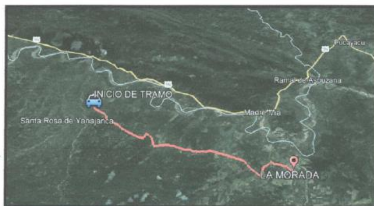
Fopografía N°02: Sub tramo II - Emp. HU-517 (Huamuco) (KM 34+000) - Molope - Santa Rosa de Baden - La Morada (KM 53+345), L = 41.345 Km.