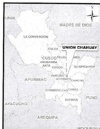
DEPARTAMENTO CUSCO – PROVINCIA ACOMAYO