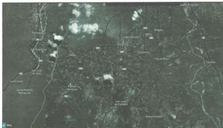
Fopografia N°01: Sub tramo I- Emp.SM-994 (L.D. San Martín) -Paraíso - Gavilán - Tres de Mayo - Dv. Nuevo Canaan.