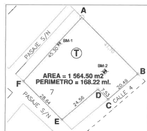
PLANO DE UBICACIÓN DE LA I.E. N°1656 – C.P. VINZOS SEGÚN COORDENADAS UTM PSAD56 17S.