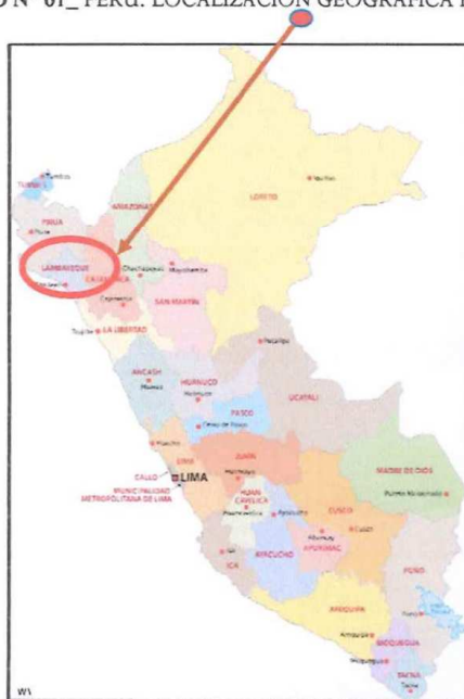
GRAFICO N° 01_ PERÚ. LOCALIZACIÓN GEOGRÁFICA EN EL PAIS.