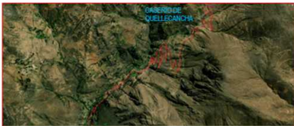
Imagen N°03: Vista espacial de la ubicación del proyecto para Mejoramiento