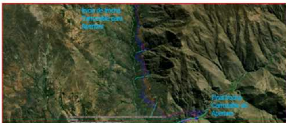
Imagen N°04: Vista espacial de la ubicación del proyecto para Apertura de Trocha