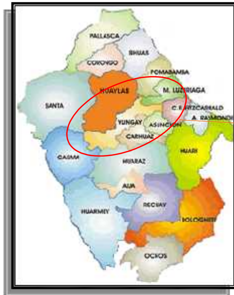
Imagen N°01: Mapa de ubicación