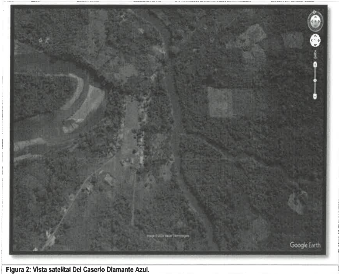
Figura 2: Vista satelital Del Caserío Diamante Azul.