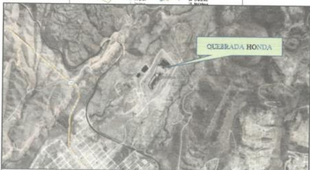
Ilustración 1. Sector Quebrada Honda - Yura.