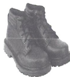
Zapato de seguridad Puntera Acero