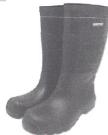
Bota de Jebe