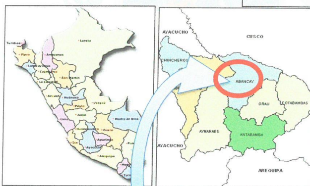
IMAGEN N° 01 DEMARCAÇÃO POLÍTICA DEL PROYECTO REGION APURÍMAC

Altitud entre : 3096 m.s.n.m. – 4650 m.s.n.m. Este : 663147.4825 m E Norte : 8511985.3722.00 m S