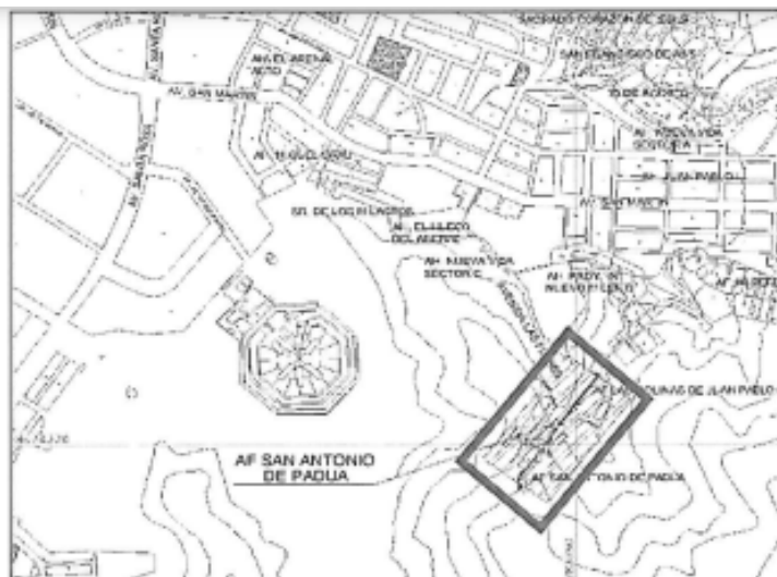
Imagen 1: Ubicación del proyecto en el Distrito de San Juan de Lurigancho.