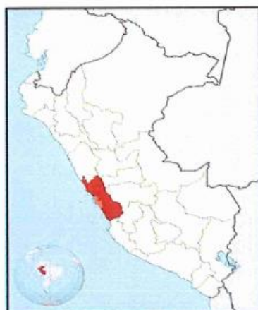
UBICACIÓN GEOGRÁFICA DEL DEPARTAMENTO DE LIMA

Región : Lima Departamento : Lima Provincia : Lima Distrito : SAN JUAN DE LURIGANCHO