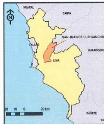
UBICACIÓN GEOGRÁFICA DEL DISTRITO DE SAN JUAN DE LURIGANCHO