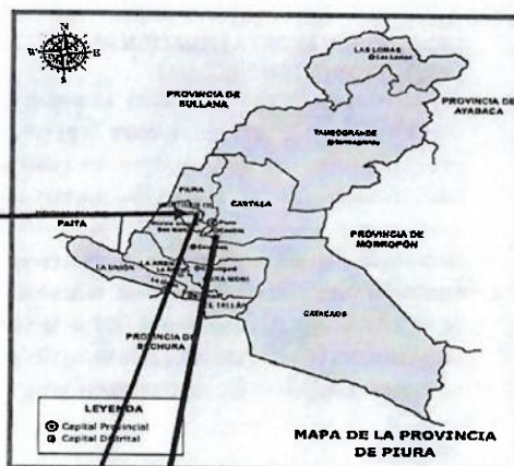
MAPA DE LA PROVINCIA DE PIURA